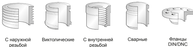
С наружной резьбой